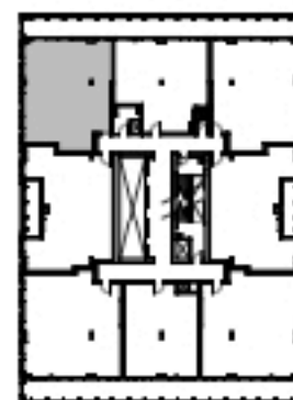
NIVEAUX 25 à 28